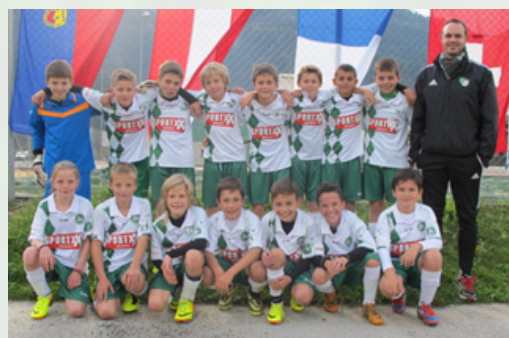
U13 FCSG Süd